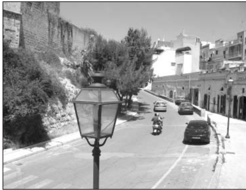
Grottaglie / Sopralluogo in ospedale del consigliere regionale del Pdc

Quanto alla posizione degli operatori del commercio va evidenziato come, «pur nel rispetto dei vincoli di legge, vi sia ormai la necessità di organizzare un'offerta commerciale più libera e più rispondente alle esigenze dell'utenza. Pertanto: se il giovedì sera resta fissato, come da tradizione, per la mezza giornata di chiusura nei negozi, la proposta è di dare però facoltà ad alcuni alimentari di restare aperti e fissare la chiusura in un altro giorno; i turni di riposo infrasettimanali saranno sospesi quando vi è una fe-